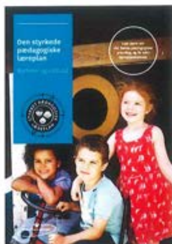
Den styrkede pædagogiske læreplan. Rammer og indhold

Inden for de krav, der følger af dagtilbudsloven, er det op til jer at beslutte, hvordan I konkret vil arbejde med den pædagogiske læreplan. Jeres læreplan skal være et dynamisk og meningsfuldt dokument, som peger fremad, og som I kan bruge aktivt i den løbende udvikling af den pædagogiske kvalitet og jeres pædagogiske praksis.